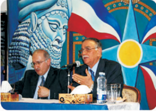
الوزير القطري الشيخ محمد بن عبد الله آل ثاني (يسار) والوزير البحريني الشيخ أحمد محمد بن محمد آل خليفة (يمين) يجلسان على طاولة الحوار في الرياض.

وقال الشيخ محمد بن عبد الله آل ثاني، وزير الخارجية القطري، إن الجانب القطري يحرص على الحوار والتفاهل في حلحلة الأزمة الخليجية، مؤكداً أن قطر تفتخر بحسن جوارها وتسامحها. من جانبها، قال الشيخ أحمد محمد بن محمد آل خليفة، وزير الخارجية البحريني، إن الجانب البحريني يحرص على الحوار والتفاهل في حلحلة الأزمة الخليجية، مؤكداً أن البحرين تفتخر بحسن جوارها وتسامحها.