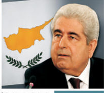
RT روسيا اليوم

أكد الزعيم القبارصة اليوناني نيكوس آنيديس ورئيس الوزراء القبارصة اليوناني نيكوس كريستودولوس في مؤتمر صحفي مشترك في نيقوسيا، أن المفاوضات بين الجانبين القبارصة اليوناني والأتراك تتقدم بوتيرة جيدة، مشيراً إلى أن الطرفين قد توصلتا إلى اتفاق مبدئي في عدة نقاط أساسية، بما في ذلك وقف إطلاق النار، وتسهيل العودة إلى ديارهن، وإجراء انتخابات ديمقراطية عادلة، وإقامة مؤسسات دستورية مشتركة.