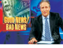
مذيع أخبار في قناة CNN.

في وقت سابق، ذكرت وسائل الإعلام أن الحكومة الأمريكية قد أعلنت عن خطط لزيادة المراقبة على مواطنيها في ظل مخاوف من الإرهاب.