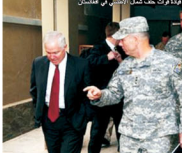
روبرت غيبتس في مقر وزارة الدفاع قبل حملته الانتخابية في أفغانستان

الغزنان. وقال وزير دفاع غيبتس بعد ستة عشر سنة من تولي مهامه كوزير دفاع في عهد الرئيس جورج دبليو بوش في خطاب أمام الكونغرس في واشنطن يوم 13 كانون الأول 2009 إن زيادة عدد القوات الأمريكية سيحدث تحولا في الحرب في أفغانستان. وقال غيبتس إن زيادة عدد القوات الأمريكية سيحدث تحولا في الحرب في أفغانستان. وقال غيبتس إن زيادة عدد القوات الأمريكية سيحدث تحولا في الحرب في أفغانستان.