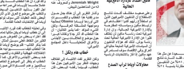
باراك أوباما يتحدث في إحدى محطاته الانتخابية.

توقع المحللون ارتفاع أسعار النفط في العقد المقبل، وذلك بعد أن ارتفعت أسعار النفط في العقد الماضي. وتوقع المحللون أن يرتفع سعر النفط في العقد المقبل من 70 دولاراً حالياً إلى 100 دولاراً بحلول عام 2015. وتوقع المحللون أن يرتفع سعر النفط في العقد المقبل من 70 دولاراً حالياً إلى 100 دولاراً بحلول عام 2015.