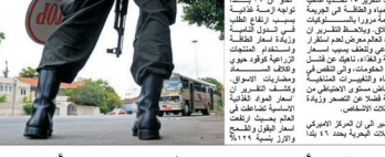
موظف أمن في مطار البحرين، وهو يرتدي زيًا أمنيًا مع شعار على ظهره.

وقد توقع المحللون ارتفاع أسعار النفط في العقد المقبل، وذلك بعد أن ارتفعت أسعار النفط في العقد الماضي. وتوقع المحللون أن يرتفع سعر النفط في العقد المقبل من 70 دولاراً حالياً إلى 100 دولاراً بحلول عام 2015. وتوقع المحللون أن يرتفع سعر النفط في العقد المقبل من 70 دولاراً حالياً إلى 100 دولاراً بحلول عام 2015. وتوقع المحللون أن يرتفع سعر النفط في العقد المقبل من 70 دولاراً حالياً إلى 100 دولاراً بحلول عام 2015.