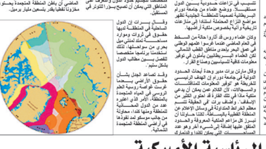
خريطة تظهر مناطق النزاع المحتملة في القطب الشمالي.

أول خريطة للقرب الشمالي تظهر مناطق النزاع المحتملة. وتوقع المحللون أن يرتفع سعر النفط في العقد المقبل من 70 دولاراً حالياً إلى 100 دولاراً بحلول عام 2015. وتوقع المحللون أن يرتفع سعر النفط في العقد المقبل من 70 دولاراً حالياً إلى 100 دولاراً بحلول عام 2015.