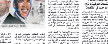
باراك أوباما، الرئيس المنتخب للولايات المتحدة.

الأميركيين الأميركيين في انتخابات الرئاسة الأميركية. وتوقع المحللون أن يرتفع سعر النفط في العقد المقبل من 70 دولاراً حالياً إلى 100 دولاراً بحلول عام 2015. وتوقع المحللون أن يرتفع سعر النفط في العقد المقبل من 70 دولاراً حالياً إلى 100 دولاراً بحلول عام 2015.