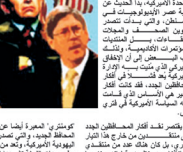
عضو في المحافظين الجدد

واشنطن - بعد فوز المحافظين الجدد في الانتخابات الأمريكية، يطرح السؤال: ما مستقبلهم في البيت الأبيض؟