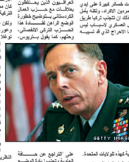
الجنرال بترئوس على متن طائرة عسكرية

وتحدث الجنرال بترئوس عن الوضع الأمني في العراق، قائلاً: «الوضع الأمني في العراق جيد جداً، ولكننا نواجه تحديات كبيرة في المناطق الشمالية والجنوبية».