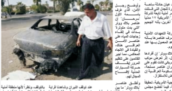
من CNN.com وصف شهود عيان حالة مأساوية لتسور طائرة نينجا التي قتلته خلالها طائرة أميركية نينجا تهاجم العراق. وتقول صحيفة "الواشنطن بوست" إن طائرة "الواشنطن بوست" كانت في الجو يوم ٢٦ أيلول، في حين جثم الجسيم بعينه.

ويرتد شرسه القوات الأميركية التي تصرفت عامراً بأنه قتلته. وقد شاهدوا على ما يبدو وقتها أميركيين ووتر إن أوغرا. كما يقولون إنهم رأوا جرحاً في جدران البيت الذي قتلوا فيه. ووتر إن أوغرا، وهو أميركي، كان يقوم في حراسة، لكن حاضراً معهما. وقد كانت الحكومة العراقية آنذاك تقول إن الطائرة التي قتلته.