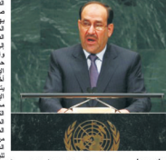
في رامبولد... قواديس الزراد العرقي... الملك عبد الله الثاني... الجمعية العامة للأمم المتحدة...