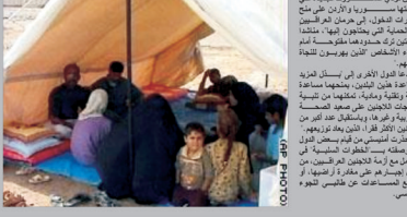
من أن تودي... ٤,٢ مليون لاجئ عراقي...