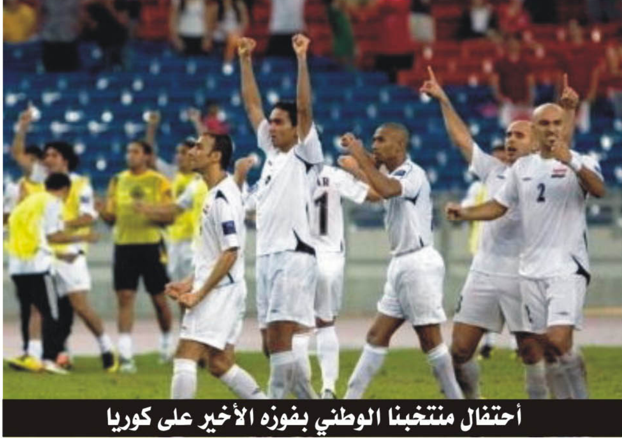
احتفال منتخبنا الوطني بفوزه الأخير على كوريا

وسيقود المباراة الحكم الاسترالي ماتيو كريستوفر وكان كريستوفر قد قاد مباراة السعودية ضد اليابان في نصف النهائي للبطولة والذي فاز بها السعودية بثلاثة أهداف مقابل هدفين، وكان طاقم التحكيم الذي يقوده كريستوفر قد تميز بالهدوء وعدم الشدة في تطبيق القانون حيث لم تشهد المباراة إشعار بطاقات ملونة عدا بطاقتين صفراء على لاعبي المنتخب الياباني تاوهيرو تاكاهارا، فيما سيقود مباراة