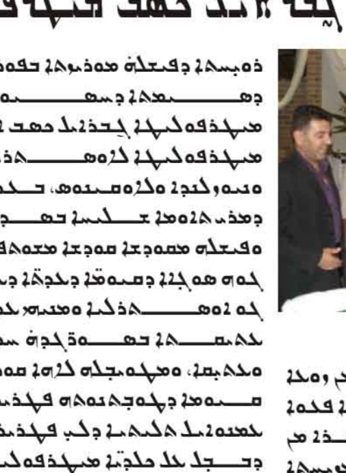
صورة توضح اجتماعاً رسمياً مع المسؤولين.

تعد البيئة والتنمية الاقتصادية من الركائز الأساسية لأي دولة تسعى لتحقيق التنمية المستدامة. وفي البحرين، تواجه هاتين الركائزتين تحديات كبيرة تتطلب حلولاً مبتكرة. من أبرز التحديات التي تواجه التنمية الاقتصادية، انخفاض التنافسية مقارنة بالدول المجاورة، مما يرجع إلى ارتفاع التكاليف التشغيلية وضعف البنية التحتية. كما تواجه البيئة تحديات خطيرة، مثل تلوث المياه الجوفية وتدهور جودة الهواء، مما يهدد الصحة العامة والقطاعات الاقتصادية المعتمدة على الموارد الطبيعية.