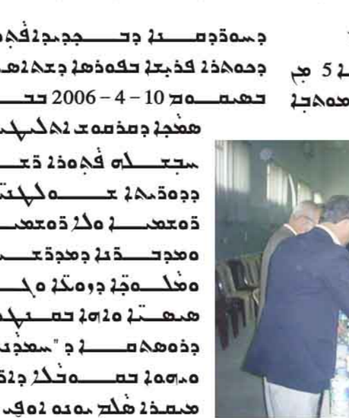
صورة توضح فريق عمل في بيئة العمل.

تعد البيئة والتنمية الاقتصادية من الركائز الأساسية لأي دولة تسعى لتحقيق التنمية المستدامة. وفي البحرين، تواجه هاتين الركائزتين تحديات كبيرة تتطلب حلولاً مبتكرة. من أبرز التحديات التي تواجه التنمية الاقتصادية، انخفاض التنافسية مقارنة بالدول المجاورة، مما يرجع إلى ارتفاع التكاليف التشغيلية وضعف البنية التحتية. كما تواجه البيئة تحديات خطيرة، مثل تلوث المياه الجوفية وتدهور جودة الهواء، مما يهدد الصحة العامة والقطاعات الاقتصادية المعتمدة على الموارد الطبيعية.