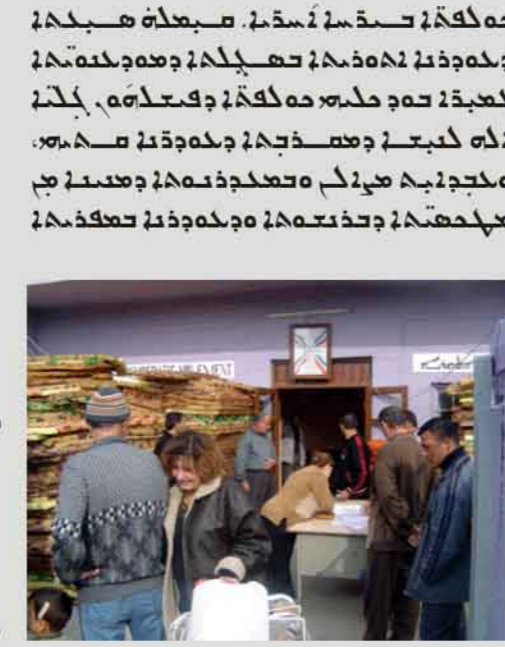
صورة توضح النشاط الاقتصادي والبيئي في البحرين.

تعد البيئة والتنمية الاقتصادية من الركائز الأساسية لأي دولة تسعى لتحقيق التنمية المستدامة. وفي البحرين، تواجه هاتين الركائزتين تحديات كبيرة تتطلب حلولاً مبتكرة. من أبرز التحديات التي تواجه التنمية الاقتصادية، انخفاض التنافسية مقارنة بالدول المجاورة، مما يرجع إلى ارتفاع التكاليف التشغيلية وضعف البنية التحتية. كما تواجه البيئة تحديات خطيرة، مثل تلوث المياه الجوفية وتدهور جودة الهواء، مما يهدد الصحة العامة والقطاعات الاقتصادية المعتمدة على الموارد الطبيعية.