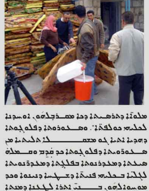
صورة توضح العمل في بيئة صديقة للبيئة أو اقتصادية.

في مواجهة هذه التحديات، يجب اتخاذ تدابير عاجلة تشمل تحسين بيئة الأعمال، وجذب الاستثمار الأجنبي المباشر، وتعزيز الابتكار والتكنولوجيا. في مجال البيئة، يجب العمل على تعزيز الوعي المجتمعي بأهمية الحفاظ على البيئة، وتنفيذ مشاريع تنموية تراعي الاعتبارات البيئية، مثل مشاريع إعادة التدوير وإدارة النفايات الصلبة.