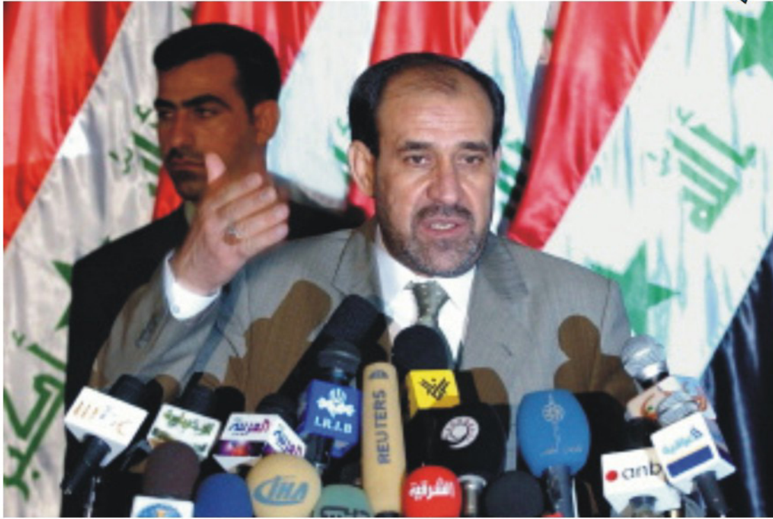
مؤتمر البحرينية في لندن

لندن - البحرينية: ناقش مؤتمر البحرينية في لندن، الذي انعقد في 26 من يونيو، الأوضاع السياسية والاقتصادية في البحرين. وتناول المؤتمر، الذي حضره ممثلون من مختلف المؤسسات والهيئات في البحرين، القضايا التي تواجهها البحرين في ظل التغييرات السياسية الأخيرة. وأكد المشاركون في المؤتمر على أهمية الحوار والتعاون بين مختلف القوى السياسية في البحرين لتحقيق التنمية والرفاهية للشعب البحريني.