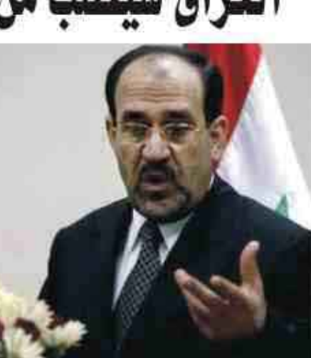
بھرا - منابحات

عراقيين الواقعة يوم الخميس ووصفها بأنها "جريمة مروعة". ويقول متحدون باسم الجيش الأميركي ان التحقيق يجري الآن في ثلاث أو أربع قضايا تشمل ادعاءات أن جنوداً أميركيين قتلوا مدنيين عراقيين. وفي واحد من هذه التحقيقات قال محامي الدفاع ان من المتوقع ان يواجه ممثلو الادعاء العسكري الأميركي اتهامات لسبعة من مشاة البحرية الأميركية وجندي بالبحرية في مقتل مدني عراقي.