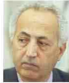
ورحّب الرئيس الأميركي

بالسفير معرباً عن سعيه للعمل سوية مع الحكومة العراقية الجديدة لمساعدة العراق في توطيد الاستقرار وتثبيت الحكم الديمقراطي فيه بحسب بيان لوزارة الخارجية. وأكد بوش اطمئناته على مستقبل الحرية في العراق لأن العراقيين يريدون العيش في مجتمع حر، وبسائرهم من المضاعب الجمّة التي تواجههم فاته معجب بشجاعة