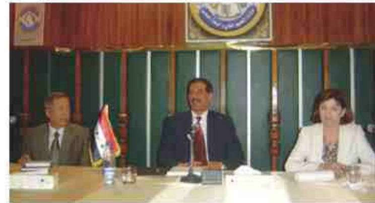
بغداد - بھرا

الدولة والمجتمع، من خلال مفاسل العمل العلمي وضع أسس علمية وموضوعية وعادلة للتعامل والتقييم والاختيار بسبب طبيعة تركيبته وما يضمه من طاقات متميزة نوعية تشكل الصيانة الحقيقية لحاضر العراق ومستقبله.