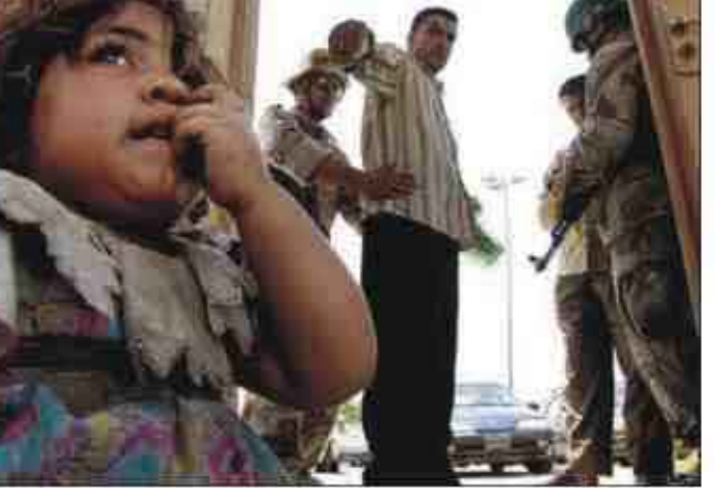
بهررا - صابر عثمة من أكثر من مصدر ان عمليات القتل في الإسحاق وقعت في ظل ظروف مثيرة للشك مشيرا الى ان أكثر من طفل قُتل في الواقعة ووصف الكاظمي التقرير بساتة غير منصف للشعب العراقي وللأطفال الذين قتلوا.

بهررا - خاص بعث السيد يونادم كنا السكرتير العام للحركة الديمقراطية الآشورية عضو مجلس النواب برقية تهنئة إلى السيد جلال الطالباني رئيس الجمهورية، والمكتب السياسي للإتحاد الوطني الكردستاني بمناسبة الذكرى الحادية والثلاثين لتأسيس الإتحاد، وجاء في البرقية: فخامة رئيس الجمهورية الأستاذ جلال الطالباني المحترم الأخوة أعضاء المكتب السياسي الموقر للإتحاد الوطني الكردستاني: في الذكرى الحادية والثلاثين لتأسيس الإتحاد الوطني الكردستاني الحليف، نتقدم لكم باسم حركتنا الديمقراطية الآشورية بأسمى التهاني والتبريكات، راجين لكم دوام التقدم والإزدهار على طريق تحقيق الطموحات المشروعة للشعب الكردي الشقيق وتواصل دوركم الوطني الإيجابي لترسيخ الأمن والاستقرار وفرض سلطة القانون وبناء المؤسسات الدستورية التي تحقق العدالة والمساواة وتكافؤ الفرص بين مكونات العراق المتأخية والتصدي للإرهاب الذي يستهدف العراق.