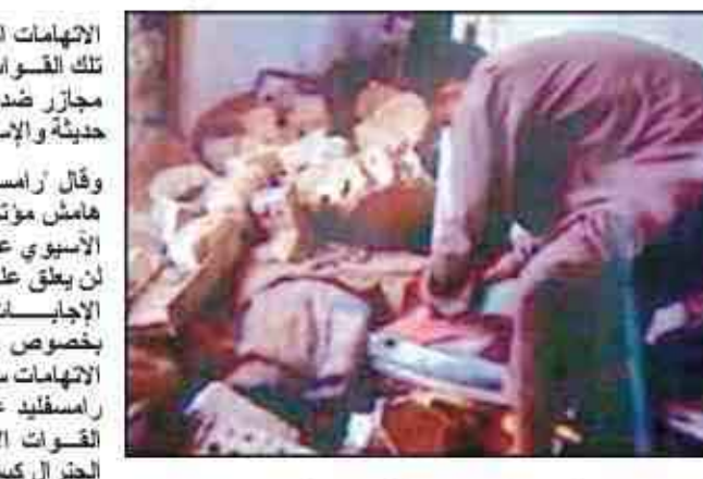
دافع عن سلوك قواته في العراق وقال إنه والتقى مع التحقيقات التي تجريها القوات الأميركية في وكان وزير الدفاع الأميركي "تودا زامسفيد" قد

ويتناقض تصريح زامسفيد" هذا مع ما أعلنه قادة عسكريون أميركيون كبار من ان قواتهم في العراق ستدخل دورات لتعلم الأسلوب الصحيح للتعامل مع المدنيين. وقال زامسفيد متحدثاً على هامش مؤتمر للأمن الإسلامي الآسيوي عقد في سنغافورة إنه ان يعلق على التحقيقات، وإن الإجابات ستسوف تظهر بخصوص التساؤلات حول الاتهامات سابقة الذكر. وأعرب زامسفيد عن ثقته بأن قائد القوات الأميركية في العراق الجنرال كيسي يتخذ الإجراءات المناسبة لضمان التزام القوات الأميركية بالمعايير العليا التي يجب ان يتحلوا بها.