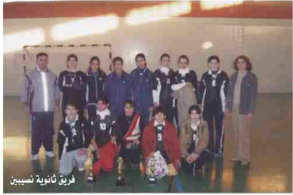
فريق ثانوية نصيبين

سبيل تحقيق أفضل الانجازات إذ لولاهم لما تحقق الذي تحقق وفي هذا العام حصلنا على المركز الأول في ألعاب كرة الطائرة للنساء والسلة للنساء ولم نجر مباريات كرة اليد وكرة القدم المصغرة هذا العام وذلك بسبب زحمة البطولات ففي كرة السلة التقينا مع ثانوية تاركين التجارة وفزنا عليها ٢٠ - صفر وفزنا على ثانوية ميديا ٣٢ - ١٩ وفي النهائي فزنا على ثانوية ليلي قاسم ٣٨ - ٣١ نقطة. وفي كرة الطائرة فزنا على التجارة ٣ - صفر، وعلى ميديا ٢ - صفر وفي المباراة النهائية مع ثانوية ليلي قاسم لم نجر المباراة لعدم حضور الفريق المقابل واعتباره خاسرا ٣ - صفر. وهذه النتائج تحققت في العام