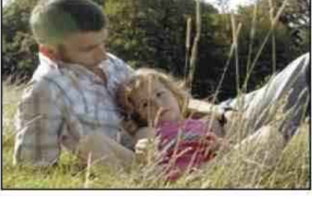
بهراء - متابعة: اشارت دراسة أميركية إلى أن المرأة قادرة بشكل

لا شعوري على معرفة شخصية الرجل بمجرد النظر في وجهه. وقالت الدراسة أن المرأة قادرة على تحديد نقاط دقيقة في الأطفال وفي وجه الرجل وقادرة أيضا على تحديد مستوى هرمون الذكورة لديه. وقالت الدراسة أن الرجال الذين لديهم وجه طفولي يميلون لإقامة علاقات طويلة الأمد والرجال ذوو الشكل الذكوري مناسبون للعلاقات القصيرة خاصة في هذا وقد قامت جامعة شيكاغو وكاليفورنيا وستا باربارا بإجراء هذه الدراسة. ويقول الباحث الدكتور داريو ماينستري 'إن النتائج التي توصلنا إليها تشير إلى