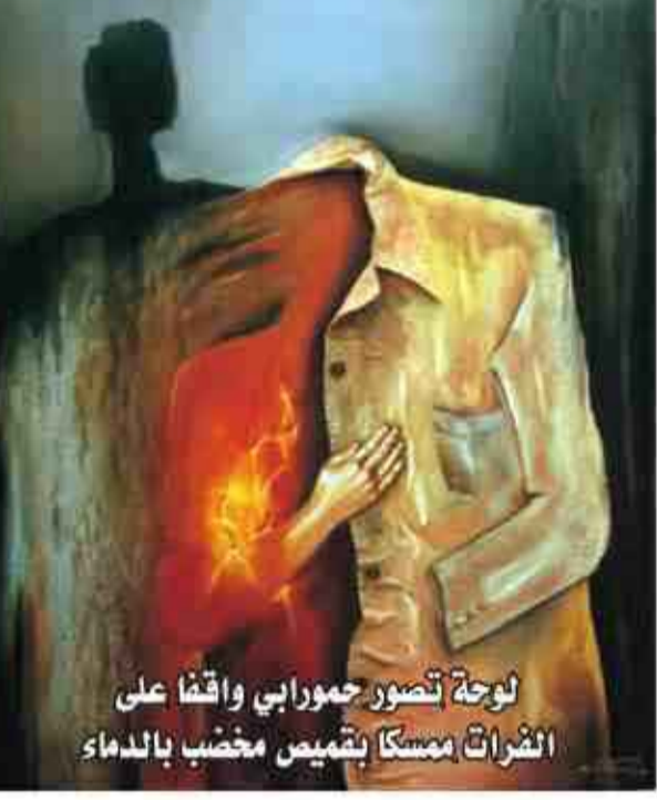
لوحة تصور حمورابي واقفا على انشراحات ممسكا بشخص مصعب بالدماء

وتجسد ياس في واحدة من لوحاتها الملك حمورابي ملك بابل القديمة ممسكا بقميص غارق في الدماء وهو يقف على ضفاف نهر الفرات. ويرمز حمورابي عند العراقيين لماضي البلاد العريق. وقالت ياس: 'حمورابي سيزيل الفحة عن العراق'. كانت الكثير من صالات الفنون التشكيلية قبيل سقوط النظام السابق تبتض بالحيوية في بغداد تلك المدينة التي لها بساطة على تصديرها فيما بعد فنانا منها جزء من التراث الوطني العراقي. أما الآن فمعظم صالات الفنون التشكيلية في بغداد مغلقة بعد أن عم العنف المدينة وفر عدد كبير من الفنانين من العراق. وقال فنانون شيسان في معرض الفنون التابع للجمعية الثقافية بوسط بغداد