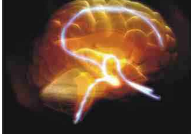
المرء داخل المتجر وهو يفكر مليا هل يشتري تفاحا أو برتقالا، تبدأ مجموعة من الخلايا العصبية في

المخ تصنيف كل نوع من الفاكهة حسب قيمتها. وتوصل فريق بحث رأسه كاميلو سادوا- شويوسا وهو باحث من هارفرد إلى هذه الخلايا العصبية بعد إجراء العديد من التجارب العملية على مجموعة من القردة تم إعطاؤها كميات مختلفة من نوعين من عصير الفاكهة حسبما ذكرت مجلة 'تيتشر'. وتيح للفرقة في البداية فرصة الاختيار بين فطرة من عصير العنب وقطرة من عصير التفاح، وبالطبع لم يكن الوصول لقرار بالصعب حيث إن القردة تحب العنب. وفي التجربة الثانية تم تقديم فطرتين من عصير التفاح وقطرة واحدة من عصير العنب ولم يختلف الاختيار هذه المرة عن سابقتها. وبسدا التردد على القردة فقط عندما وجدوا أنفسهم في محل الاختيار بين ثلاث قطرات من