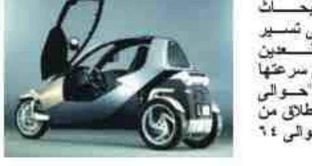
الميكرو وثلاثة أقدم حوالي ٩٠ سنتيمتراً من السيارات السياحية الصغيرة العادية.

وبعد ثلاث سنوات من الأبحاث والتطوير خرجت السيارة التي تسير على ثلاث عجلات ومزودة بمقعدتين للسائق وركب إضافي، وتبلغ عرضها حوالي ٩٠ سنتيمتراً مع سرعة الاطلاق من ١٠٠ كيلومتر مع سرعة الاطلاق من ٤٠ كيلو متر في سبع ثوان فقط. وقال المهندسون ان عرض السيارة يبلغ ثلاثة أقدام حوالي ٩٠ سنتيمتراً وهي أقل عرضاً بحوالي ٢٠ إنشاً حوالي ٥٠ سنتيمتراً من سيارات ونمسوايين في ٢٠٠٢.