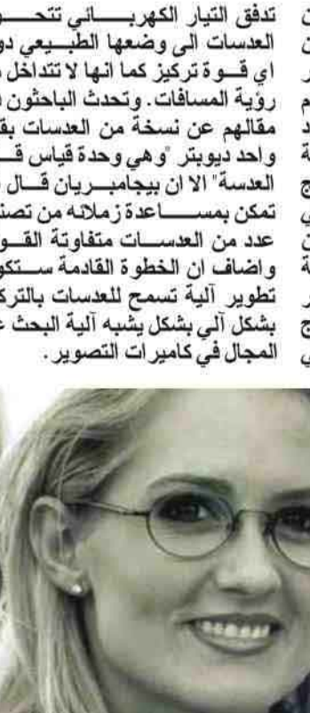
تحرير: غازي المنشاوي

تدقق التيار الكهربائي تتحول العدسات الى وضعها الطبيعي دون اي قوة تركيز كما انها لا تتداخل مع رؤية المسافات. وتحدث الباحثون في مقالهم عن نسخة من العدسات بقوة واحد ديوبتر "وهي وحدة قياس قوة العدسة" الا ان بيجامبريان قال انه تمكن بمساعدة زملائه من تصنيع عدد من العدسات متفوقه القوة. واضاف ان الخطوة القادمة ستكون تطوير آلية تسمح للعدسات بالتركيز بشكل آلي بشكل يشبه آلية البحث عن المجال في كاميرات التصوير.