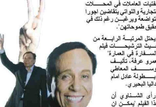
رانيا فريد شوقي

بعضهم البعض على حصر الأدوار على الأبناء. هذه الظاهرة أثرت في مستوى أداء النجوم وترجع شباك التذاكر عن اكتشاف المواهب وصنع الإبطال بسبب صعوبة المنافسة أمام سيطرة وهيمته واحتكار كبار النجوم صناعة الأفلام المصرية وحصرها على عوائلهم يساعد