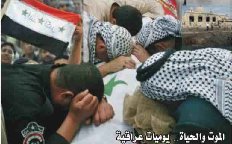
الموت والحياة.. يوميات عراقية

يفتح بها الفوز ديوانه "ألوان باسلة" ويقول في بعض سطورها: "الحرب ليست حربنا.. لكنها أخذت أعمارنا للتجوال والهاث والكلام المسلول بالأكاذيب، أمنتنا كأسماننا وعويل الأمهات.. فأذا سفعل من دون تلك الحرب؟. الحرب أخذت ثيابها القديمة وأسماء العائلة.. حملت زودتها أسماؤها. أعطتنا عناوين مشوشة وجبالاً من هواء.. علمتنا أننا مؤجلون للموت الوطني".