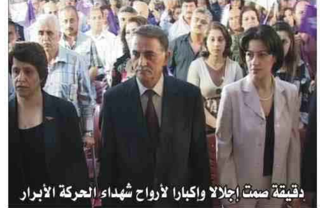
دقيقة صمت لإجلال وإكبار أرواح شهداء الحركة الأبرار