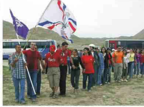
كركوك: أكد نيسان

وأقام اتحاد الطلبة والشبيبة الكلدوآشوري وبالتعاون مع المدارس السريانية في محافظة كركوك احتفالية خاصة بمناسبة اعياد نيسان رأس السنة البابلية الآشورية. وشاركت المدارس السريانية المختلفة مدرسة بهرا