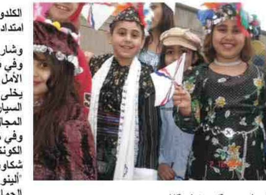
شوشن سركيس / شيكاغو

وشاركت جماهير غفيرة في هذه الاحتفالات، وفي ظهر الثلاثاء الماضي بدأت مسيرة نيسان الأمل، وعلى شارع "سركون بيلفارد" الذي يخلي، في كل سنة وفي هذا اليوم، من سير السيارات بأمر من حاكم مدينة شيكاغو لفسح المجال أمام أبناء جاليتنا ليحتفلوا بالمسيرة وفي هذه السنة كان في مقدمتها عضوة الكونكرس الأميركي السيدة "جانيس شاكوسكي" وممثلي دوائر الحكومة المحلية في "النيوي" وممثلي منظمات صديقة ومنظماتنا الجماهيرية ثم تلتها مواكب مزينة بأعلامنا