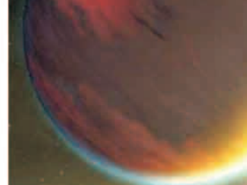
ويحدث الطيف حين ينقسم الأشعاع إلى الأطوال الموجية لمكوناته مثلما ينقسم الضوء من مخروط إلى ألوان الطيف السبعة، لكن في هذا البحث فقد فتت العنماء الضوء في المنطقة تحت الحمراء.

ويقول ريتشاردسون أنه ربما توجد مياه بالفعل لكنها مختفية وراء طبقة السحب الكثيفة.