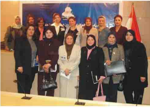
قرب الالى الكمال. ومن احتقر ما ابدع الرب في صنعه فهو كافر... كافر. قلم المرأة رمز الإنسانية ونبع الحنان والرفقة، لما اكمل الله تكوينها رأى

المرأة والحقوق الإنسانية لتشارك المرأة اخاها وزوجها وابناءها في العمل الوحدي ودعم المسيرة التضالية التي بدأها المناضلون الأبطال في حركتنا منذ أكثر من ثلاثين عاما ولبسولوج الهدف المنشود وهو وحدة امتنا وتبليها حقوقها القومية والإنسانية والثقافية والإدارة الذاتية على ارض اجدادنا المقدسة سهل نينوى حيث آثار اولئك العظاما وشاخسة الى يومنا هذا، والقضاء نظرة اليها تدفعنا للتقدم الى الامام دون توقف.. وبهذه المناسبة أود أن أقول: إذا كانت المرأة جدتي، هي التي قطعت مشيئتي وأول من سمعت صرختي. إذا كانت المرأة امي، أنتجيتي فأصبحت والدتي، كل خلية من جسدي.. في رحمها المقدس تكونت.. فمنها سماتني.. تلك المرأة قد تكون توأمي في