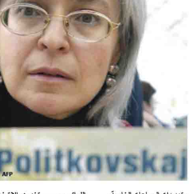
ان يقال عنه انه مليء بالاشواك، ولا تتوقع المرأة ان يقدم اليها حقها على طبق من ذهب.. بل عليها ان تشد الهم لتتكون تسونامي جديد يقبل الطاوله الى جميع اللاعبين التقليديين لتضم اليهم "شواوا" أم أوبا" لاعبا جديدا أساسيا في جميع جوانبهم.

نسبة 11 في المائة وفي عام 2005 كانت نسبتهن 13 في المائة من القتلى مقابل 2,0 في المائة فقط عام 2003. ومن المناطق الأكثر خطورة على المرأة جمهوريات الاتحاد السوفيتي السابق. وسأقت المنظمة كمثال حالة الصحافية أوغولسبار مورادوفا مراسلة إذاعة فرى يوروب فيسج ترمكاستان التي ماتت في السجن في أيلول العام الماضي بسعد أن تعرضت على الأرجح للضرب. وقالت المنظمة في بيان إن المثال الصارخ على ذلك هو حالات اغتيال انا بوليتكوفا صحافية صحافية الروسية التي كانت تتدد بانتهاكات حقوق الإنسان في الشيشان والتي قتلت بالرصاص في السابع من تشرين الأول العام الماضي. وفي عام 2006 قتل 82 صحافيا في العالم بينهم تسع نساء أي