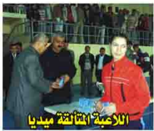
اللاعبات الثلاثة ميدانيا

دهوك: هرمز موسى توج الفريق النسوي لنادي سنحاريب الرياضي بكرة السلة بطلا لمحافظة دهوك للمرة الثانية عشرة على التوالي منذ البطولة الأولى التي أقيمت عام ١٩٩٣، في البطولة النسوية التي اختتمت في المحافظة الخمسين الخامس عشر من شباط الجاري بحضور جماهيري كبير غصت به مدرجات قاعة دهوك المغلقة، وبمشاركة أربعة أندية هي إضافة لسنحاريب كل من كرة وراخو وعقرة، وتواصلت مباريات البطولة على مدى أربعة أيام متواصلة بطريقة التسقيط الزوجي.