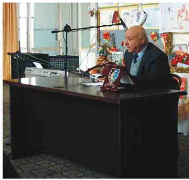
المدرسي في الموصل.

الملحن والموسيقار المعروف زكي إبراهيم، واستذكر العمري العلاقة التي ربطته مع المحتفى به منذ ريعان الشباب حتى افتراقا في الوقت الذي انتسب فيه زكي إبراهيم لمعهد الفنون الجميلة في خمسينيات القرن المنصرم في حين كان العمري يؤدي خدمة العلم واسترسل الأخير في ذكر الأحداث التي كونت ملكة الإبداع لدى الموسيقار زكي إبراهيم حينما انتسب ملحنًا في مديرية النشاط المدرسي فتكونت خلية نحت انتجت العديد من الألحان والأغاني الشجية التي تطيبت بالملكة الموسيقية الغالية واصفا إياه بأنه تبع لا ينضب وقامة لا تظال.. بعدها جاء الدور على المحتفى به ليسرد لمحات من مشوار حياته ففقال إن أول أغنية قدمها في أول نسخة من المهرجان الربيعي الذي كان يقام في مدينة الموصل حملت عنوان "محروسة يا موصل"، ووضع كلمات الأغنية الشاعر صفاء محمد علي، أما الأغنية الثانية والتي أداها الفنان الراحل محمد حسين مرعي بعنوان "موصلنا فرحانة" فكانت من كلمات الشاعر سالم الخباز، وتم تسجيل الأغنيتين في الإذاعة التي كان يشرف عليها آنذاك "محمد سعيد الصحاف" وزير الإعلام فيما بعد، حيث بادر محافظ الموصل في خمسينيات القرن المنصرم بنقلنا بسيارته الشخصية إلى بغداد لتسجيلها في استوديوهات الإذاعة