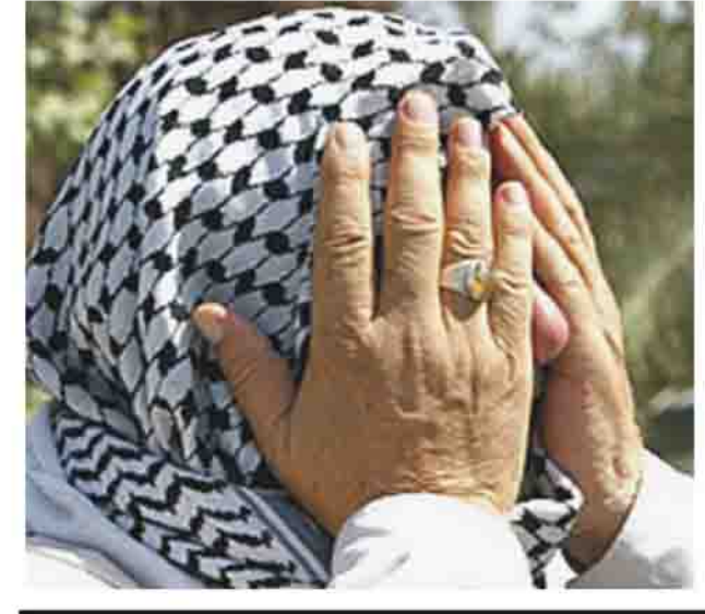
يشار إلى ان العنف في العراق دفع بالعديد من المسرحيين العراقيين مخرجين وممثلين الى تقديم عروضهم خارج البلاد خشية تعرضهم الى مخاطر محتملة، ومع ذلك يستمر النشاط المسرحي في العراق.