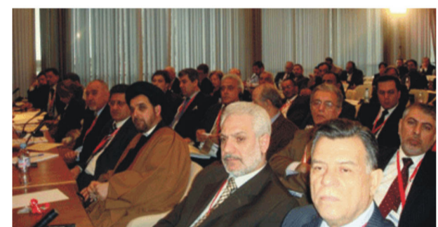
البرلمان والحكومة؟، بحضور شخصيات من البرلمان والحكومة في مثل هذا التجمع وبالمطلق أن هناك تطابق وإلا.. ما كانت الحاجة لعقد مثل هذا التخصصي؟.

الإعلام وتطوير برامجه لا يمكن أن يحقق النجاح دون الاستماع لآراء وملاحظات المسؤولين ودورهم للحضور السبل العملية لدعم ودفع الإعلام لزيادة حيويته وبما يخدم واقع الوطن للأفضل.