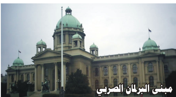
مبنى البرلمان الصربي

المستهدفون من حملة الحزب الديمقراطي كانوا من المتمدنين، والطبقة الوسطى، بالإضافة إلى الشرائح المؤيدة لمشروع الانضمام إلى الاتحاد الأوربي. ومن القضايا التي طرحها الحزب أثناء الحملة كيفية جعل الحياة أفضل، والدخول إلى الاتحاد