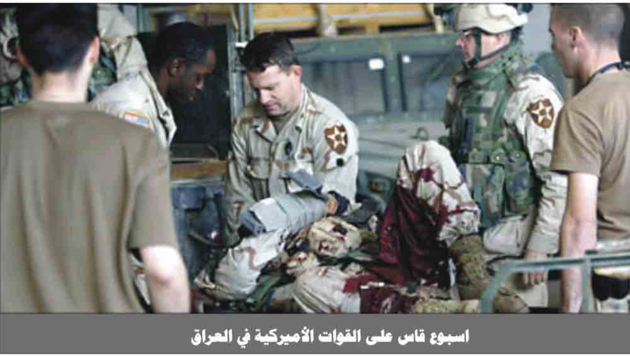
اسبوع قاس على القوات الأمريكية في العراق