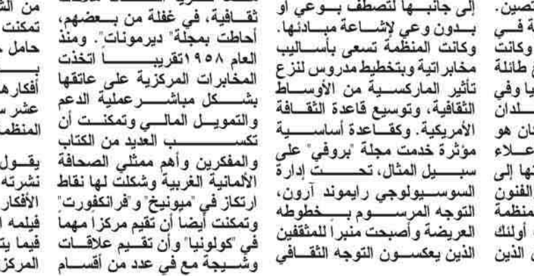
THE CIA AND THE WORLD OF ARTS AND LETTERS THE CULTURAL GOLD WAR FRANCES STONOR SANDERS