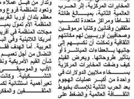
THE CIA AND THE WORLD OF ARTS AND LETTERS THE CULTURAL GOLD WAR FRANCES STONOR SANDERS

نفسه سقط فيما يسمى بالدعاية المضادة. وعندما يحدد المجال الحزب الاشتراكي القومي الشهيرة كبينهاور التي قامت بشرايع طموحة دون ان يكون لها إمكانية تحقيقها ماليا. وكانت الدار تعين هاينرش بول وتتسرع أعماله. ويضع مينوفا بول وفق مصادره في قائمة المتعاونين. أن مؤسسة هاينرش بول القسامنة حتى الان رفضت تصديق المزامع عن موقف بول في سؤال من محرر "تاجشبيغل". ويعتقد بأن المنظمة حاولت ايضا مع