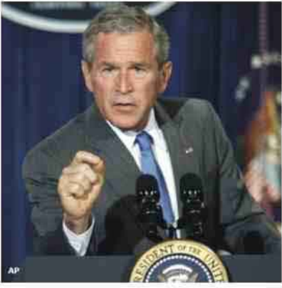
ميدل ايست اونلاين:

ناتسي بيلوسي وزعيم الاغلبية في مجلس الشيوخ هاري ريد الى مد القوات الاميركية الموجهة حاليا في العراق بالموارد التي تحتاج اليها لمواصلة القتال. لكنهم اصرروا على نقل الاعباء الى العراقيين بعد اربع سنونات من غزو العراق لاسقاط نظام صدام حسين وعلى بدء عملية اعادة انتشار لقواتنا خلال الاشهر الاربعة او الستة المقبلة". وقالوا في البيان ان "القادة السياسيين العراقيين لن يتخذوا الخطوات اللازمة لتسوية سياسية للمشاكل المذهبية في بلادهم ما لم يدركوا بان الالتزام الاميركي ليس بلا نهاية". واضافوا ان "زيادة مشاركة القوات العسكرية في العراق توجه رسالة خاطئة ونحن نعارضها". الا ان بوش اكد في خطابه "شددت اكثر من عشرين الف جندي امركي اضافي للعراق"، وقال مساعدوه ان الخطة تدعو الى نشر 1700 جندي للمساعدة في احلال الامن في بغداد واربعة آلاف من عناصر مشاة البحرية الاميركية لمطاردة عناصر القاعدة في محافظة الانبار. الا ان الرئيس الاميركي حذر من انه "حتى اذا طبقت الاستراتيجية الجديدة كما خطط لها، ستستمر اعمال العنف القاتلة"، كما توقع بان تكون هذه السنة "موتية وعنفية". وقال "علينا ان نتوقع مزيدا من الخسائر العراقية والاميركية في هذا البلد حيث قتل اكثر من ثلاثة آلاف جندي امركي منذ الغزو في آذار 2003. ولم يكشف بوش