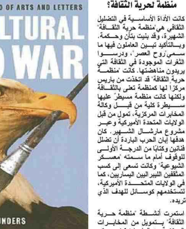
FRANCES STONOR SAUNDERS