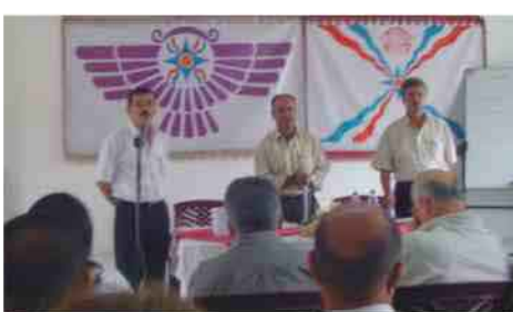
عقد فرع بغداد للحركة الديمقراطية الاثورية يوم السبت السادس من تشرين الأول الجاري كونفرانس لإنتخاب الهيئة العاملة للفرع وفقاً