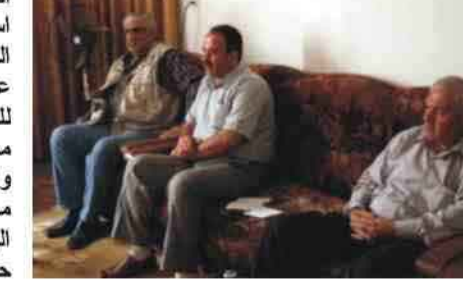
زار مقر فرع أربيل للحركة