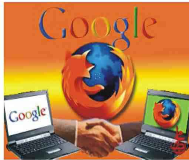
بهررا - متابعيات رغبة من غوغل في زيادة انتشار خدمتها الشهيرة Google Earth، طرحت النسخة الرابعة من البرنامج التي تتيح إمكانية تحميل صور

وقفا للإحصائيات التي أصدرتها غوغل للمرة الأولى فإن أكثر من ١٠٠ مليون مستخدم حول العالم يستخدمون خدمة الخرائط منذ بداية تشغيلها قبل عام كامل، كما أن هذه الخدمة تعد منافسا رئيسيا وهاما أمام شركتي ياهو و AOL، اللتان توفران نفس الخدمة عبر شبكة الإنترنت.