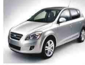
وتعتزم الشركة إزاحة الستار عن

وقد أوضحت الشركة أنها تعتزم تزويد هذا الطراز بمحركات مختلفة أحدها من فئة التيربوزيل بسعة لترية ١٦٠٠ سي سي، أما المحركات الأخرى فهي من فئة محركات البنزين بسعات لترية مختلفة تتراوح بين ١٤٠٠ سي سي و ١٦٠٠ سي سي و ٢٠٠٠ سي سي.