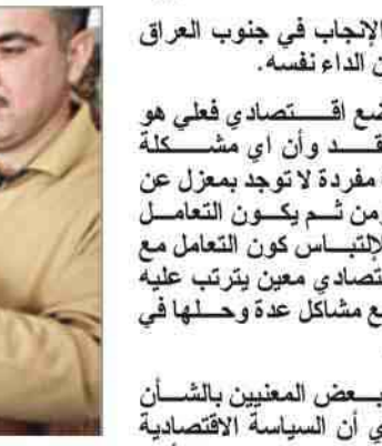
سبن الإنجاب في جنوب العراق يعانون من الداء نفسه.

نتيجة من زيادة الطلب مع وجود مستويات إشباع استهلاكي عالية وكان في إجراء البنك المركزي الذي يبلغ ١٢% بعد أن كان ١٠% ويعلل بيان للبنك إجراءه هذا بأنه جاء لخفض نسب التضخم الجاري بعدلته المرتفعة التي بلغت ٥٣% بسبب ٢٠٠٥ و ٢٠٠٦. وذلك بخفض نسبة السيولة وتشجيع الإيداع وتبع رفع معدل سعر الفائدة المذكور توجيه البنك المركزي إلى المصارف التجارية برفع معدلات أسعار فوائده الإيداع ومع وجود فوارق بسيطة بين المصارف فإن فوائده المصارف التجارية على قروضها القصيرة الأمد بلغت ١٥% ومتوسطة الأمد ١٧% والطويلة الأمد بلغت ١٩% وفيما لو أن التضخم الجاري في العراق