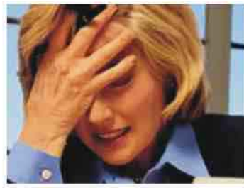
من هذا المرض هم من النساء، موضحين بأنه قد يكون وراثيا.

صحية، ومحاولة تجنب أي خطر مهما كان ضئيلا يمكن أن يعرضهن للإصابة بالمرض جراء الإصابة بالصداع النصفي.