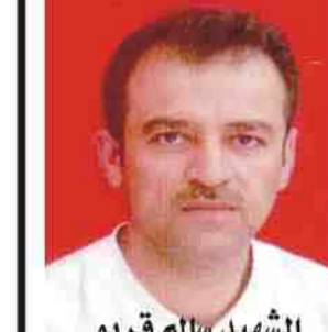
بيغداد، والشهيد كان تولد ١٩٨٧، وأقيم مجلس العزاء على روح الشهيد في باطنايا.