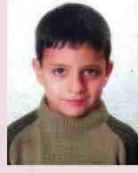
نييف سلطان إيشايا