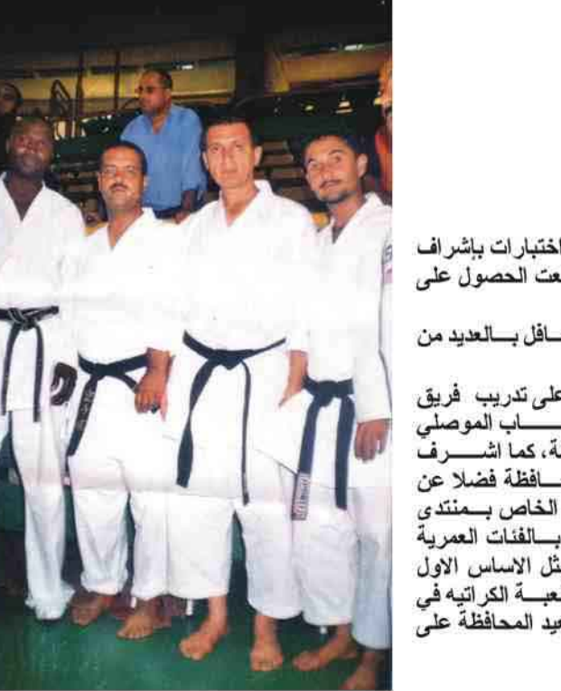
بالدورة الاخيرة دخلت اختبارات باشراف نخبة من الحكام واستطعت الحصول على الحزام الأسود ٤ دان.