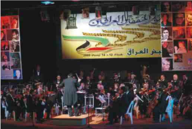
غابت عنها الامسيات منذ اعوام. واضاف 'بعيدا من موجات العنف ستمتع على ديمومة الفرقة'

لارتقاء بالتقافة الموسيقية بعدما عانت فراغا كبيرا وتأملاً في ان يتغلب الفن على العنف. وتعتبر الفرقة السيمفونية العراقية من الاقدم في المنطقة، وكانت انطلقت مطلع أربعينات القرن الماضي مع مجموعة من طلاب معهد الفنون الجميلة في بغداد واساتذته. لكنها تأسست رسمياً عام ١٩٥٩ برعاية وزارة التربية العراقية قبل ان تشرف عليها وزارة الثقافة. وتوالى على قيادة الفرقة ١٧ شخصاً منذ عام ١٩٧١ بعضهم فنانون اجانب واخرهم العراقي محمد امين عزت. ورأى عزت ان