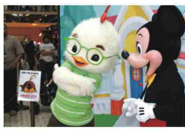
فيستا للانتاج المسرحي لن تتأثر بهذا التغيير.

واشارت الشركة الى ان وحدات 'والت ديزني فيتشر انيميشن وبيكسار ستوديو وميراماكس فيلمز ويونا فيستا غروب للموسيقى ويونا