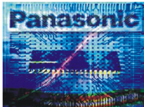
الكمبيوتر، طورت باناسونيك بنية عاصمة قادرة على تحمل ضغط خارجي.

أطلقت باناسونيك أحدث منتجاتها من أجهزة الكمبيوتر المحمولة، وهي Toughbooks من طرز cf-w4 و cf-y4 و gcf-t4.