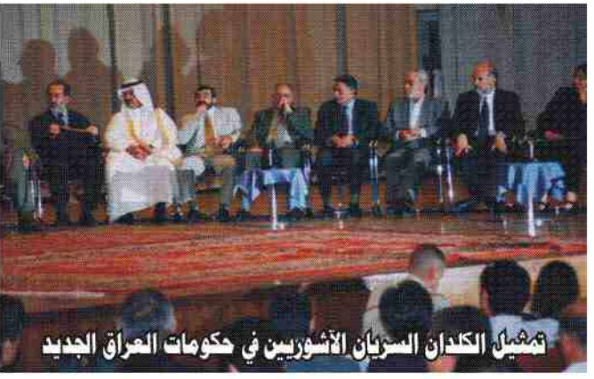
تمثيل الكلدان السريان الآشوريين في حكومات العراق الجديد

٢٠٠٥ • عضو لجنة صياغة الدستور. • عضو مؤسس ورئيس مكرر للمعهد العراقي للسلام "IP". • عضو رئاسة المجلس الوطني للسلام والتضامن في العراق. • عضو مشارك في مؤتمرات عديدة لمنظمات المجتمع المدني "المؤتمر القومي الكلداني السرياني الآشوري اكتوبر ٢٠٠٣، مؤتمرات دعم حركة المرأة العراقية، مؤتمر بروكسل ٢٠٠٥، وغيرها". • عضو مؤسس ورئيس مكرر للمعهد العراقي للسلام "IP". • عضو رئاسة المجلس الوطني للسلام والتضامن في العراق.