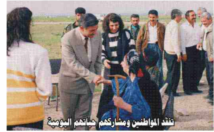
تفتد المواطنين ومشارككم حياتهم اليميرع

المؤقت - رئيس لجنة الإعمار والخدمات العامة. • ٢٠٠٥ عضو الجمعية الوطنية العراقية - رئيس لجنة الخدمات والإعمار. البطاقة السياسية: • ناشط ضد نظام البعث العنصري منذ عام ١٩٧٠. • من مؤسسي الحركة الديمقراطية الآشورية ١٩٧٩، والسكرتير العام للحركة حاليا. • عضو مؤسس ومشارك في