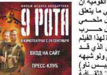
فيلم "الفرقة التاسعة" يحقق أرقاماً قياسية

فقد رأيت في الفيلم "اول اعلان قداسة لجنود الاتحاد السوفياتي في أفغانستان. من جهته، توه اتحاد مقاتلي أفغانستان السابقين بهنداء واعتبره "مطابقاً للواقع". أما في العروض، فيصق الجمهور متولاً في صالات موسكو عند انتهاء الفيلم الذي اشترت القناة التلفزيونية الرسمية الأولى حقوقه. ويمكن سر نجاح الفيلم في الدعاية الضخمة التي راقت عرضه وفي أنه فيلم تشويقي وملئ بالحركة. إلا أن السر يكمن أيضاً بحسب المحللين في أن الفيلم يلبي الرغبة المتنامية في روسيا في السنوات الأخيرة في ايجاد أبطال قوميين جدد وتمأذج وطنية تشهد لتاريخ مشترك عظيم. إلا أن المحللين يحذرون من تعرض ذاته من أن هذا الفيلم يمجذ الروح الشمولية التي طغت على ثقافة الاتحاد السوفياتي إذ أنه يعرض قصة هذه الفرقة التي يأتي عناصرها من جميع أنحاء الاتحاد السوفياتي السابق واعرأسه مروراً بالشيشان. وهم يتسربون إلى أنه لا يتطرق إلى الحرب من زاوية أنها كانت مستقماً تورط فيه