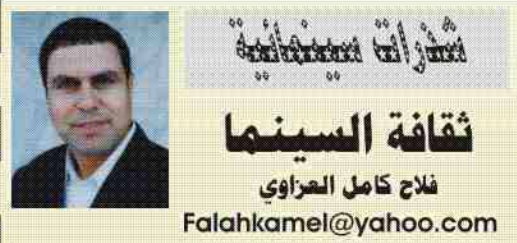
ثقافة السينما فلاح كامل الحراوي

السينما ثقافة بحد ذاتها. والمخرج إذا لم يكن مثقفاً دراسياً وحياتياً فسوف نرى أفلاماً فاشلة وأخيراً منحت جامعة برافانيس في مرسيليا الدكتوراه الفخرية للمخرج يوسف شاهين وهذه الدكتوراه الثالثة له بعد دكتوراه جامعة بومباردييه ودكتوراه من الجامعة الأميركية في القاهرة.. كل هذه الشهادات العليا تقديراً للسينما ولرجل السينما "شاهين" المثقف.