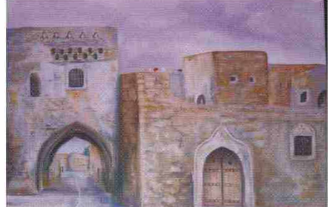
عصف الزمان بها بعد قبلة واحدة من قبيلات فيها نست ما سببه لها ولسكانها من الماسي هكذا يصفها الأب د. سوني.