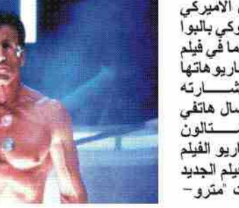
ميدل إيست اوتلاين: يعود الممثل روكي بالبوأ سيلفستر ستالون إلى لعب دور الملاكم روكي بالبوأ الذي كان وراء شهرته قبل ثلاثين عاماً في فيلم سادس من السلسلة التي كتب سيناريوها وسيكون من إخراجها كما أعلنت مستشارته الإعلامية. وأوضح ميشيل بيغا في اتصال هاتفي في لوس أنجلوس "غرب كاليفورنيا" أن ستالون (٥٩ عاماً) سيتولى إخراج وكتابة سيناريو الفيلم كما يشارك في إنتاجه. وسيبدأ تصوير الفيلم الجديد في كانون الثاني حسب استديوهات منترو-

غولدوين- ماير" التي أطلقت السلسلة والمشاركين في الإنتاج "ريفولوشون استديو". ويشترك في إنتاج الفيلم أيضاً استديو كولومبيا" في حين أن المنتجين التاريخيين لسلسلة أفلام "روكي" ابرفين وينكلر وروبرت شاروتوف سيكوون المنتجين التنفيذييين. والفيلم يتتبع قصة الملاكم روكي بالبوأ حين يعود إلى الحلبة بعد سنوات من الاعتزال، للمرة الأخيرة بعد وفاة زوجته. يشار إلى أن سلسلة أفلام روكي حصدت ٤٩٥ مليون دولار في أميركا الشمالية في السنوات الـ ٢٩ الماضية.