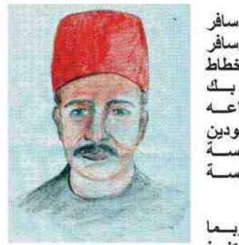
كان محباً للعرلة.. وربما ساعدت هذه في أن يتفرغ لدراسة الخط دراسة متواصلة.. حيث تسوا مكانة عالية في تاريخ الخط العربي.