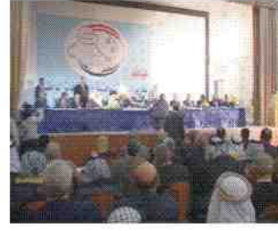
بغداد - بهرا

في الوضع السياسي العراقي ومظاهر الأزمة التي تعاني البلاد منها، وازداد ان الهدف من المؤتمر كان للاعداد لمشروع وطني عام من اجل النهوض بالمهام السياسية التي تخدم مبادئ الوفاق الوطني مع استحقاقاتها القادمة المتمثلة بالانتخابات.