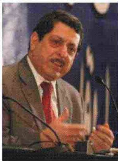
مخصصا للمعتقلين للإدلاء بأصواتهم.

وقال إيار في حديث له أمس الأربعاء: "المعتقلون حسب الاتفاقيات الدولية ومبادئ حقوق الإنسان لهم الحق في الإدلاء بأصواتهم". لكن إيار أشار إلى أن المفوضية بانتظار القوائم التي ستقدمها القوات المتعددة الجنسيات باسماء المعتقلين لئتم السماح لهم بالإدلاء بالأصوات، بالرغم من أنه لم يؤكد إن كان اسم الرئيس المخلوع صدام حسين سيكون ضمن الأسماء رغم أنه تم الإعلان عن السماح له بالإدلاء بصوته إذا كان اسمه ضمن القوائم المقدمة من قبل القوات المتعددة الجنسيات.