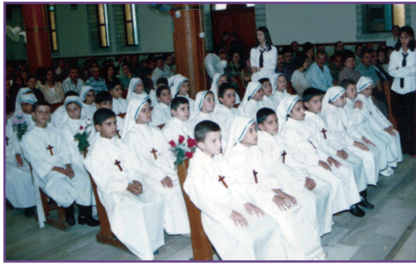
بھارتیہ سہولت کے دوران بھارتیوں کی شرکت