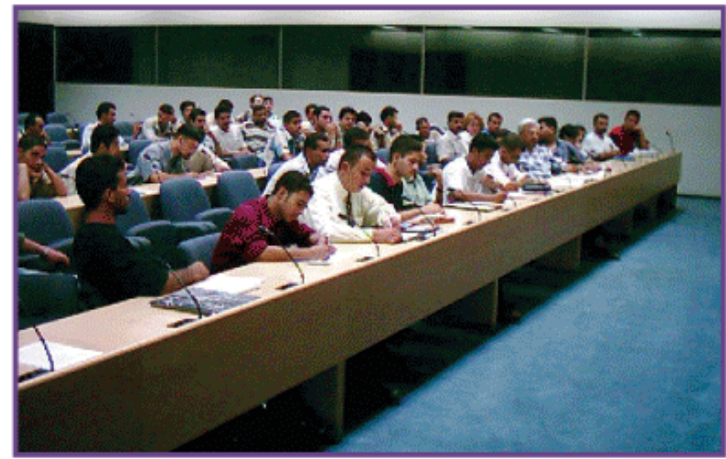
بھارتیہ سہولت کے دوران بھارتیوں کی شرکت