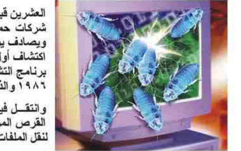
ميدل إيست أون لاين: احتفلت، إن جاز التعبير، فيروسات الكمبيوتر بعيد ميلاده

وتسبب بخسائر سنوية تقدر بالمليارات. وتتعرض الكمبيوترات التي تدار بانتظمة تشغيل ويندوز إلى أكبر الأخطار نتيجة لانتشارها الكبير، في حين تبقى بقية أنظمة التشغيل مثل "ال" و"يونيكس" و"لينوكس" بعيدة عن الأصابة. وساعد الإنترنت على تحصيل الإصابات بالفيروسات التي أوبئة معلوماتية تشل الكثير من شبكات المعلومات حول العالم. وانتشرت أنواع متعددة من الفيروسات ودود الكمبيوتر منذ ذلك الحين مما خلق صناعة كاملة تدر مليارات الدولارات