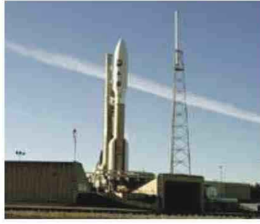
الفضاء الأمريكية "ناسا" بولاية فلوريدا.

وصرحت السيدة تومبوك، "لقد غمرتنا مشاعر جياشة.. لم نستطع أن أقام.. لقد كان أمراً جميلاً. انتظرنا إرسال المسبار إلى كوكب بلوتو لمدة طويلة".