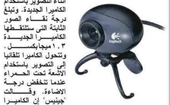
جينيس إن الكاميرا

العرب اونلاين: تعزز شركة "جينيس" ومقرها في تايوان طرح كاميرا كمبيوتر جديدة مزودة بخاصية التصوير بالأشعة تحت الحمراء لمن يرغبون في تجاذب طرف الحديث عبر مواقع الحوار على الإنترنت في ساعات الليل. وذكر مكتب الشركة في