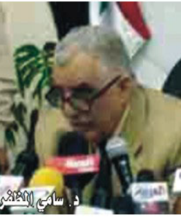
بغداد - بھرا

أصدر أ.د. سامي عبد المهدي المظفر وزير التعليم العالي والبحث العلمي، أوامر وزارية جديدة بتعيين أو إعادة تعيين ٨١١ شخصاً من حملة الشهادات العليا، ومن المفصولين والمتضررين السياسيين.