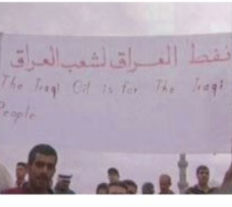
بھرا - وكالات

ومع الحكومة العراقية. وأضاف أن اتفاقاً تم توقيعها في الاونة الأخيرة بين العراقيين وشركة أميركية لوضع أجهزة القياس، من دون أن يضيف أي تفاصيل. وقال مصدر في الوزارة إن الاتفاق تم توقيعها في الاونة الأخيرة بين العراقيين وشركة أميركية لوضع أجهزة القياس، من دون أن يضيف أي تفاصيل. وقال مصدر في الوزارة إن الاتفاق تم توقيعها في الاونة الأخيرة بين العراقيين وشركة أميركية لوضع أجهزة القياس، من دون أن يضيف أي تفاصيل.