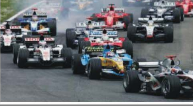
بهره - متابعات

بهره - متابعات يسعى الاتحاد الدولي للسيارات "فيا" الى تخفيض تكلفة المشاركة عبر لائحة قوانين جديدة ستطبق في بطولة العالم للفورمولا واحد اعتباراً من موسم ٢٠٠٨. وتتبع هذه التعديلات التي نشرها الاتحاد الدولي الفرصة أمام الفرق المتواضعة التي تقتصر الى الرعاي الرسمي الكبير الذي يغطي قسماً كبيراً من التكاليف العالية للمنافسة بشكل أفضل كما تقلل الهوة بين فرق الطليعة وتلك الأقل شأنًا. وبدأ الاتحاد الدولي العمل على هذه التعديلات منذ بداية العام الحالي ويشترك في دراستها وتحضيرها جميع المسؤولين عن فرق البطولة كما كان لتسعين ألف من المشجعين ١٨٠ بلد حول العالم فرصة اعطاء رأيهم عبر اقتراحات وجهت الى مركزي الـ "فيا" في جنيف وباريس. وتواجه بطولة العالم مازاً حقيقياً بسبب التكاليف المرتفعة والتفاوت الشاسع في ميزانية الفرق المشاركة إذ أن معظم الفرق الصغيرة لا تتجاوز موازنتها في الموسم الواحد أكثر من ١٠٠ مليون دولار في حين أن الفرق الكبيرة مستعدة لدفع ما يتجاوز حدود ٣٠٠ مليون دولار مما يقلل من قدرة الصغار على منافسة الفرق الكبيرة والمنحصرة بثلاث أو أربع شركات على أقصى تقدير. وتتمثل هذه الفرق بـ "رينو" بطله العالم و"ماكلارين" و"ميرسيدس" وصيفتها و"فيراري" والي حد ما "وليامس كوزوروث" بعد انفصال بي بي ام "ديلو" الامانية عن الفريق الانكليزي.