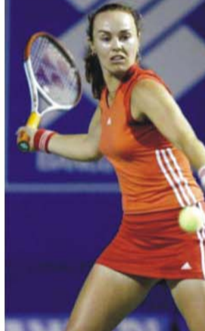
بهره - وكالات

بهره - وكالات أكدت نجمة كرة المضرب السابقة ماريتينا هينغيس انها ستعود الى المنافسات رسميا خلال دورة "غولد كوست" الأسترالية الدولية المقررة في اليوم الأول من مطلع عام ٢٠٠٦. وقالت هينغيس: "أعرف بأنني سأخوض مباريات صعبة لكنني في حاجة الى هذا النوع من المباريات لكي استعيد مستوى السابق". وكانت هينغيس اعتزلت رسمياً عام ٢٠٠٢ بعد إصابات متكررة في كاحلها، لكنها أعلنت بأنها مستعدة للعودة الى الملاعب الشهر الماضي. وتأمّل هينغيس الفائزة ببطولة أستراليا المفتوحة أولى البطولات الأربع الكبرى للمشاركة في بطولة "ملبورن" المقررة منتصف الشهر المقبل أيضاً مشيرة الى انها تلقت بطاقة دعوة من أجل ذلك. وأكدت هينغيس بأنها جاهزة لمنافسة أفضل اللاعبين في العالم على الرغم من غيابها لفترة ثلاث سنوات عن الملاعب وقالت: "أود ان أصبح لاعبة رقم واحد في العالم".