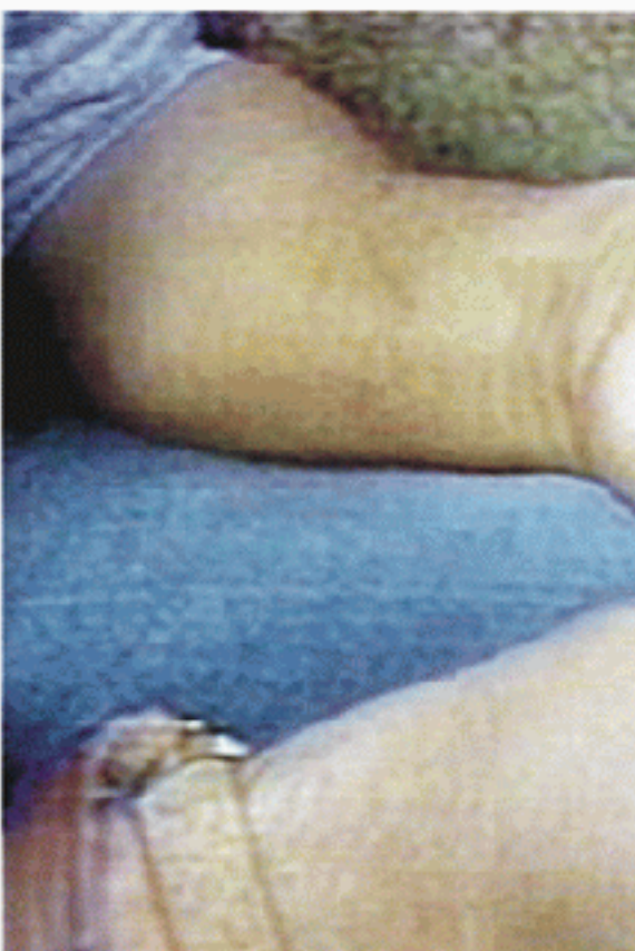
عالية وهذا يتم في المشافي وبالطرق الدوائية لإنقاذ حياتهم.