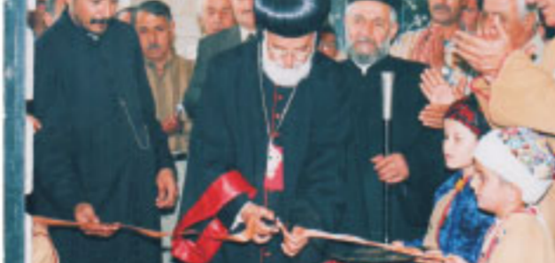
وشارك المطران جرجيس القس موسى رئيس أساقفة الموصل للسريان الكاثوليك كلمة قيمة ثمن فيها القامتين على المهرجان وكيف أن أولئك الرجال المؤمنين وبالرغم من عدم توفر الإمكانيات لهم كانت تفتح لنا الآن إستطلاعاً ونقدموا للكنيسة ما يعجز عن