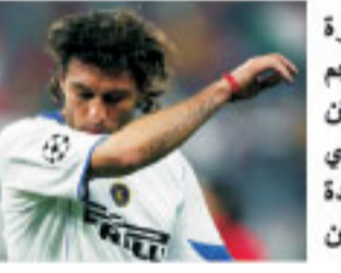
تستضيفه ألمانيا قد تكون ساهمت في اختياره البقاء في الدوري الإيطالي ومع ميلان تحديداً

أعلن نادي ميلان الإيطالي لكرة القدم عن تعاقده مع مهاجم منتخب ايطاليا وفريق إنترميلان السابق كريستيان فييري للالتحاق إلى صفوفه لمدة عامين تنتهي يوم ٣٠ حزيران ٢٠٠٧ وكان فييري فسخ عقده وديا مع إنترميلان القطب الآخر بمدينة ميلانو قبل أربعة أيام بعدما لعب في صفوفه ٦ اعوام قداماً من لاسيو ومن قبله أتليكو مدريد الإسباني وعقب فسخ تعاقده مع إنترميلان تلقى فييري عدة عروض من أندية محلية واجنبية، غير ان رغبته في إيجاد مكان له ضمن تشكيلة المنتخب المشارك في تصفيات مونديال ٢٠٠٦ الذي