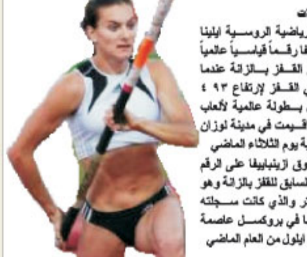
رقم قياسي عالمي بالقفز بالزانة

بهرنا: وكالات سجلت الرياضية الروسية ايلينا زرينبافيا رقماً قياسياً عالمياً جديداً في القفز بالزانة عندما نجحت في القفز لارتفاع ٤ ٩٣ متر خلال بطولة عالمية لاعباب القسوي اقيمت في مدينة لوزان السويسرية يوم الثلاثاء الماضي وبهذا تتفوق زرينبافيا على الرقم القياسي السابق للقفز بالزانة وهو ٤ ٩٢ متر والذي كانت سجلته هي نفسها في بروكسل عاصمة بلجيكا في ايلول من العام الماضي