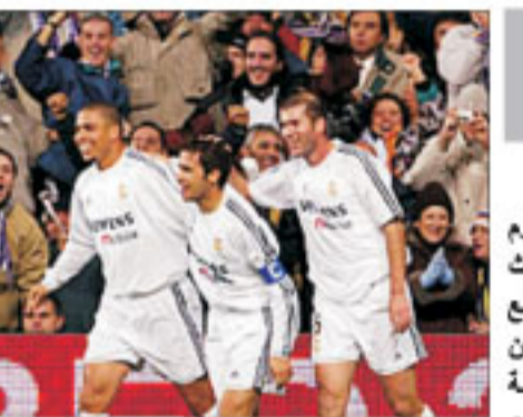
والإسبانية، حسب ما ذكر رئيس النادي الإسباني

الدعوة الموجهة الى نادي الكرخ الرياضي للمشاركة في بطولة الإستقلال التي ستقام في اربسد الاردن للفترة من ١٠ ٢٠ ٧ ٢٠٠٥ والمواقفة ايضاً على توصية لجنة الحكام من الدرجة الثالثة التي الدرجة الثانية ومن الدرجة الثالثة الى الدرجة الاولى ممن تنطبق عليهم الشروط الواردة في لائحة الحكام المعتمدة في اللجنة وتم الاعتراف الى امانة سر الاتحاد بإصدار الامر الإداري الخاص بذلك