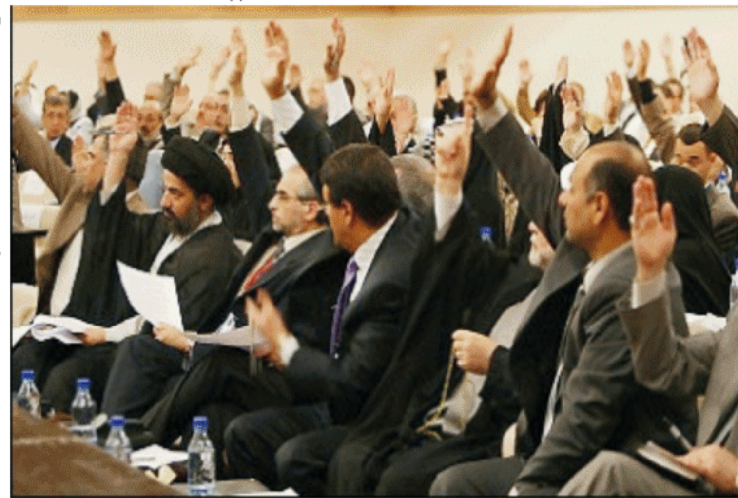
أعضاء الجمعية الوطنية العراقية أثناء المصادقة الأسبوع الماضي على لجنة كتابة الدستور الدائم للعراق

وأكد رئيس الجمهورية الطالباني اثناء حديثه امام الصحفيين مع نائب وزير الخارجية السوري وليد المعلم انه مستعد لزيارة دمشق بمجرد ان يتلقى دعوة، وطلب منه إبلاغ الرئيس السوري بشار الأسد بأنه يتطلع إلى مساعدته لترسيخ الاستقرار في العراق