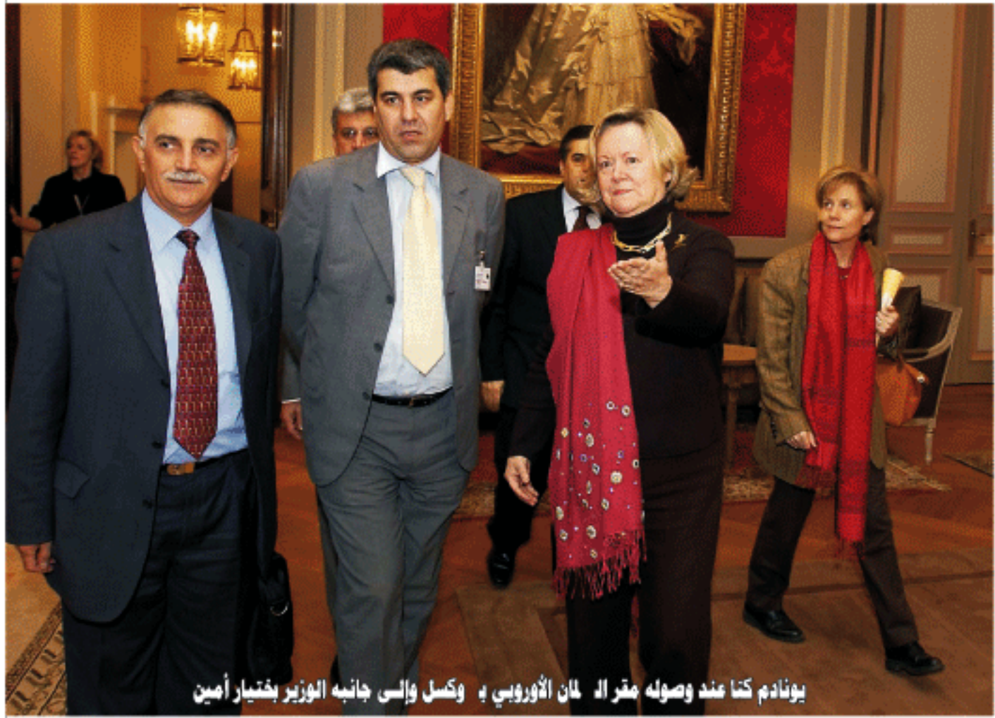
يونايم كنا عند وصوله مع مرافقه مان الأوروبي ووكسل وإلى جانبه الوزير خيتيار أمين

في ظل العولمة هذا ونناقش المؤتمر دراسات حول النظام الفدرالي وتطبيقاته السياسية المختلفة وتجربة الدول التي تبنته كأساس لنظامها السياسي، كما ناقش المؤتمر الواقع السياسي العراقي ومدى ملاءمة النظام الفدرالي لهذا الواقع المتعدد قسوماً وثقافياً ولغوياً ودينيًا، وتحديات الوحدة الوطنية في ظل نظام سياسي فيدرالي