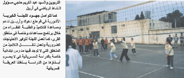
كما نظمت مدارسنا السريانية في أربيل دورى لكرة السلة والطائرة في الثانويات، وكانت تتناجح الألعاب، للكورة الطائرة والمدارس الثانوية ١ ثانوية عكسلاو، للبنات، المرتبة الأولى ٢ ثانوية نوروز، المرتبة الثانية، ٣ ثانوية أور، المرتبة الثالثة