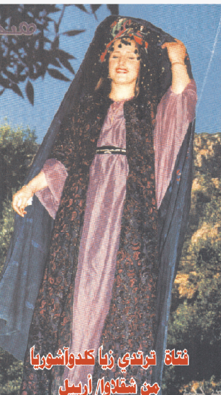
نيتا توادى زيا كندواشوريا من شتلاو/ أربيل

تدعو الهيئة الإدارية للجمعية الخيرية الكلدانية جميع أعضاء الهيئة العلية للاجتماع يوم الجمعة ١٧ من المصادف ٢٠٠٥ في تمام الساعة الحادية عشرة صباحاً في مقر الجمعية الكلدان في حي الكراة، محلة ٩٠٣، وذلك بوجمل الاجتماع الى يوم الجمعة لسنة ٢٠٠٣ وتقرير ديوان الرقابة المالية وتقرير الهيئة الإدارية وفي حالة عدم اكتمال النصاب القانوني بوجمل الاجتماع الى يوم الجمعة التالي المصادف ١٤ و١٥ من نفس المكان والزمان