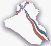
قائمة الرافدين الوطنية

التعددية، الحرية والديمقراطية.. أساس الاستقرار الدائم. لا للتمييز على أساس الانتماءات الدينية أو القومية. ضمان حقوق البرأة ومشاركتها مع الرجل دليل رقي حضارة الرافدين. استقرار الوطن.. طريقنا للخلاص من القوات الأجنبية.